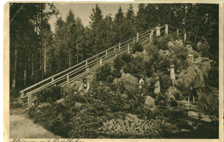
Alpinum mit Rodellbahn